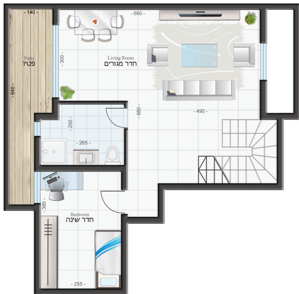
אופציה 2 קומת מרתף: 51.52 מ"ר פטיו: 9.28 מ"ר